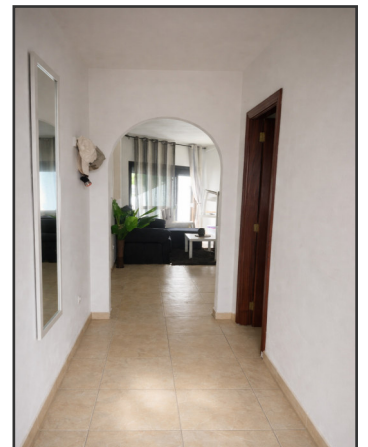
Flur / Eingang