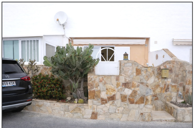
Eingang mit Stellplatz