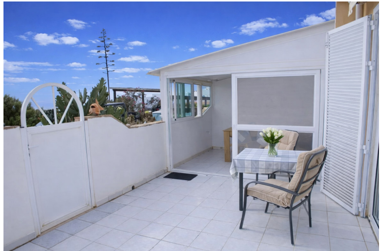
Sonnenterrasse mit Wintergarten

REAL ESTATE CONSULTING | ASESORIA INMOBILIARIA