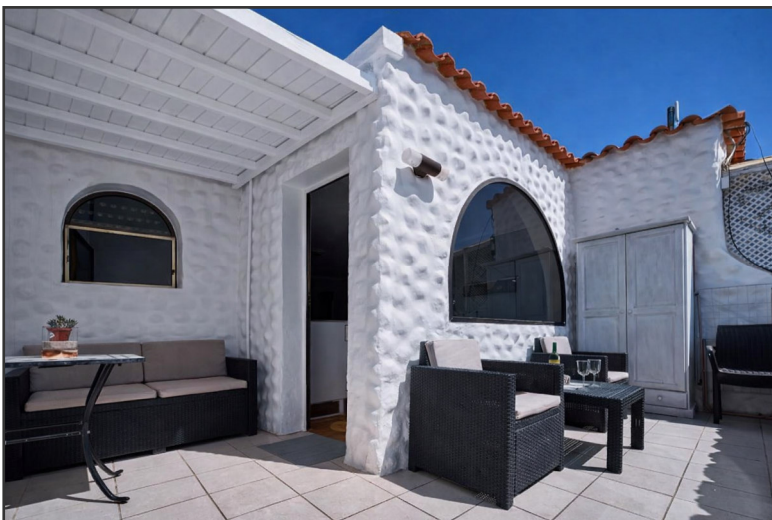
Terrasse | Teilüberdacht