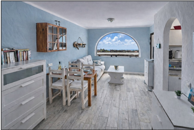
Wohn- / Esszimmer mit Meerblick

REAL ESTATE CONSULTING | ASESORIA INMOBILIARIA